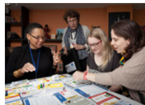
Présentation du jeu KIJOULOU lors de la conférence de presse du 28 mai 2015, Accueil de jour Agora de l'association EMMAÛS Solidarité, Paris (Ier).

La conférence de presse de lancement du jeu KIJOULOU a eu lieu le jeudi 28 mai à l'accueil de jour l'Agora d'EMMAÛS Solidarité. Elaboré par la mission logement de l'association, il a été développé et revisité grâce au concours du Groupe Logement Français. KIJOULOU a été présenté à de nombreux acteurs du logement social en France - associations, collectivités, État, bailleurs. KIJOULOU a été conçu par des travailleuses sociales d'EMMAÛS Solidarité intervenant en structures d'hébergement, dans le cadre de l'atelier « Préparation au logement ». L'atelier est proposé aux personnes hébergées en complément du suivi social individuel assuré par les équipes sur le terrain. Il consolide le travail mené pour favoriser l'accompagnement vers et dans le logement auprès de personnes en attente de logement ou déjà locataires. Avec KIJOULOU les équipes vont vivre le temps d'un tour de plateau un mois de location dans un logement social. KIJOULOU permet de faire progresser le parcours résidentiel en préparant les participants à répondre à des questions sur l'habitat, à équiper leur logement et à gérer de la meilleure façon possible leur budget. KIJOULOU est un outil pédagogique et ludique destiné à tous les professionnels de l'insertion et aux acteurs du logement. Il favorise le dialogue, le débat, le partage d'expériences et la convivialité.