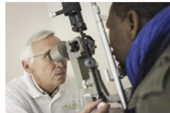
Consultation VisionSoliDev au CHRS Georges Dunand de l'association.

Depuis janvier 2014, cette association a rencontré dans notre CHRS situé dans le 14 ème arrondissement, 374 personnes accueillies dans nos services qui, le plus souvent, n'ont pas eu d'examen ophtalmologique depuis plusieurs années, voire n'en n'ont jamais bénéficié. 80% présentaient une gêne de santé visuelle notable, 1/3 une vision défaillante. 356 paires de lunettes ont été fournies, dont 35 en verres progressifs, 58 personnes ont été orientées vers des examens complémentaires, le tout pour une valeur de 132 368 € au prix moyen du marché.