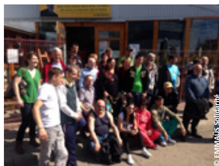
Photo du groupe présent lors de cette célébration à Iasi.

Ces trois communautés partagent un réel dynamisme pour diversifier leurs actions :