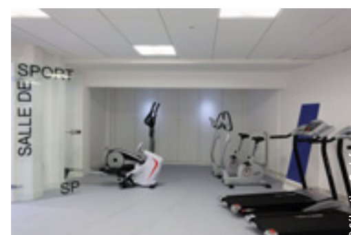
Salle de sport du Centre d'Hébergement d'Urgence et de Réinsertion Sociale Prost de l'association au Pré Saint-Gervais.

La préoccupation énergétique était présente, façade photovoltaïque pour la pension de famille du Quai de Valmy, capteurs solaires au Pré Saint-Gervais. Il en a été de même pour l'accessibilité aux personnes handicapées.