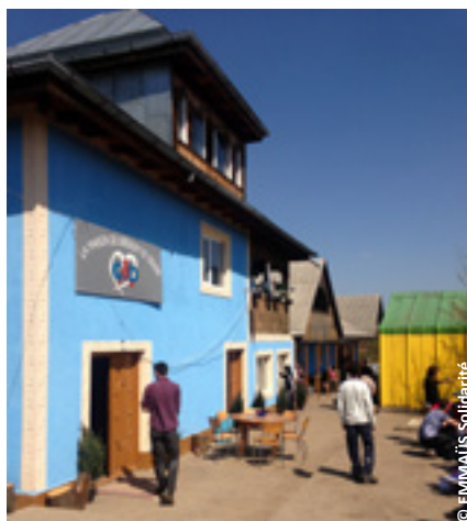
Centre d'accueil et d'hébergement à Iasi.

La deuxième journée a permis de visiter la communauté de Iasi et d'aborder le préoccupant sujet des conditions de vie des Roms sur un site prêté par une communauté religieuse, mais dénué d'accès à l'électricité et l'eau.