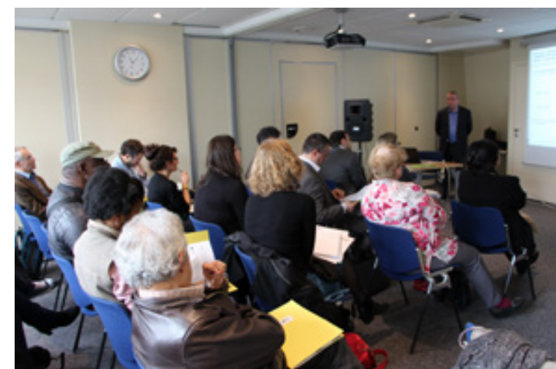
Conférence de presse sur la restitution sur l'étude « Précarité et accès à la santé visuelle », à la Maison de l'Optique, Paris (VIe), le 2 avril 2015.

Pour plus d'information consultez le dossier de presse.