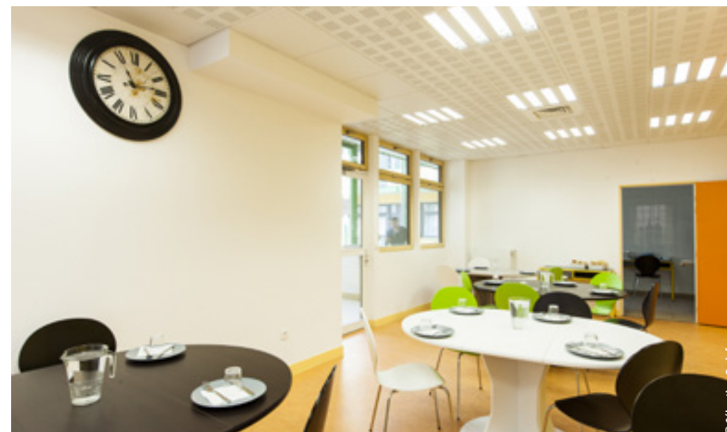
Salle commune du Centre d'Hébergement d'Urgence Tlemcen, Paris (XXe) de l'association EMMAÛS Solidarité.