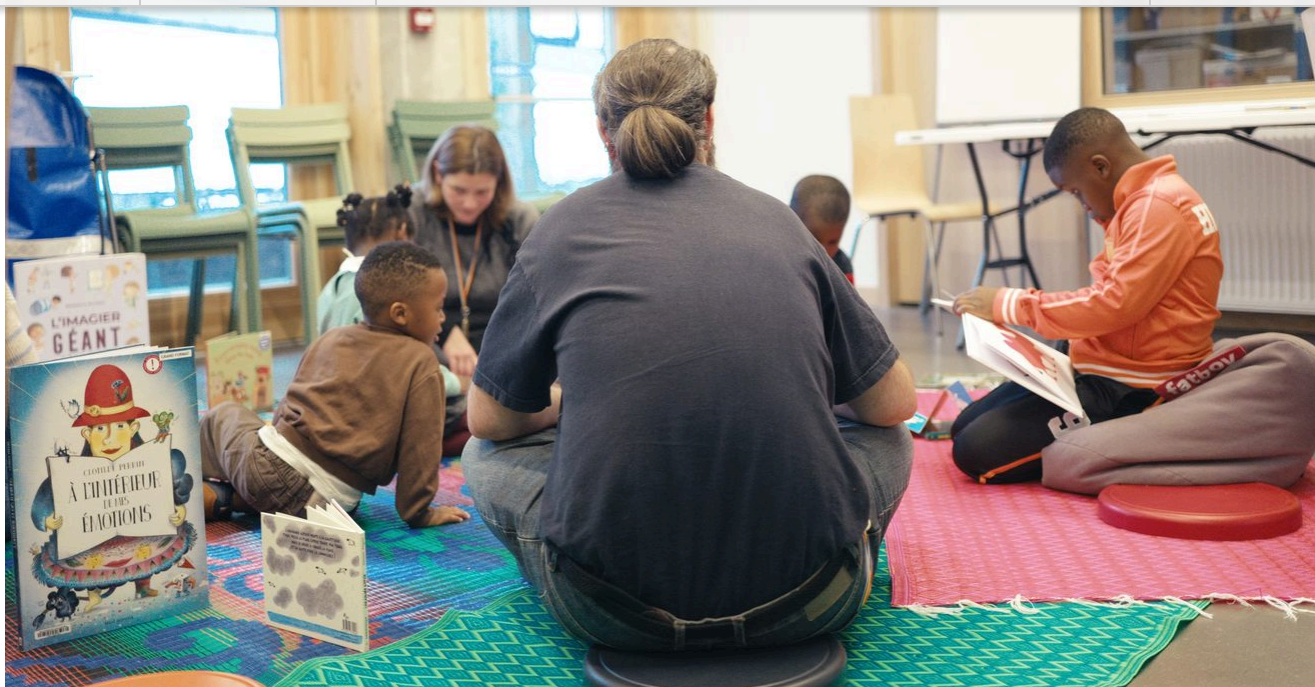
Un groupe d'enfants participe à un atelier de lecture avec 2 travailleurs sociaux à la Maison des réfugié-es.

Depuis la rentrée 2024, le COPIL Naître & Grandir porte, au sein d'Emmaüs Solidarité, une réflexion collective sur la place des enfants dans l'accompagnement social. Une initiative née du terrain qui vise à mieux prendre en compte les besoins spécifiques des enfants accueilli·es, de plus en plus nombreux au sein des structures.